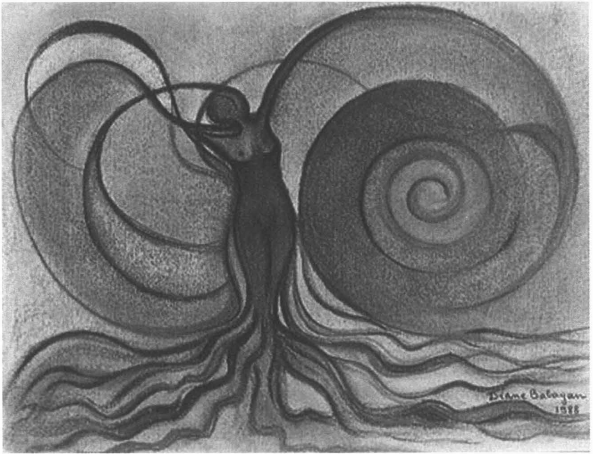
DIANE BABAYAN, Aurore , 1988