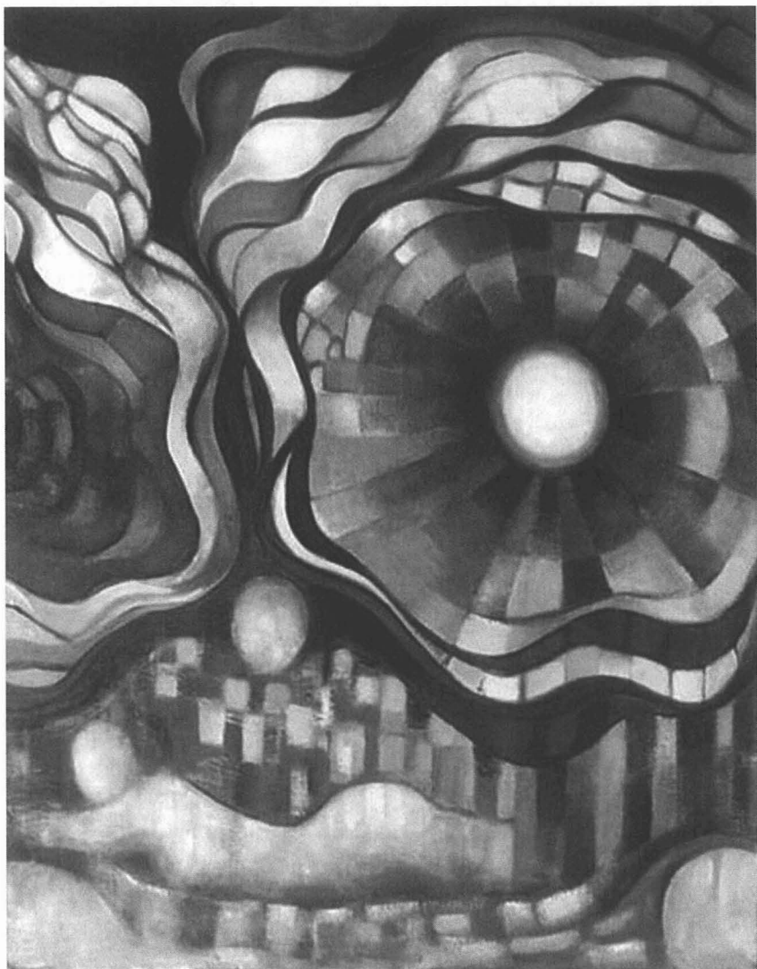
DIANE BABAYAN, Soleil gelé , 2001