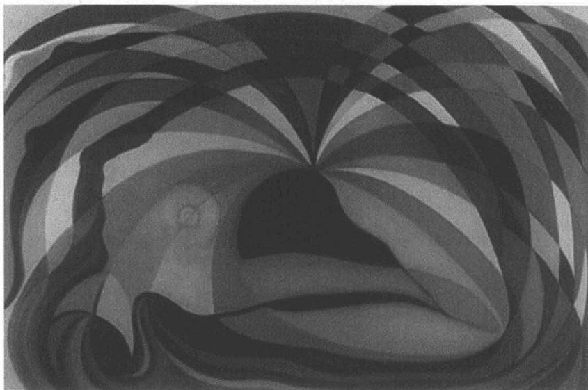
DIANE BABAYAN, Le Pont , 1997