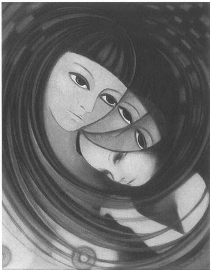
DIANE BABAYAN, Osmose , 1987