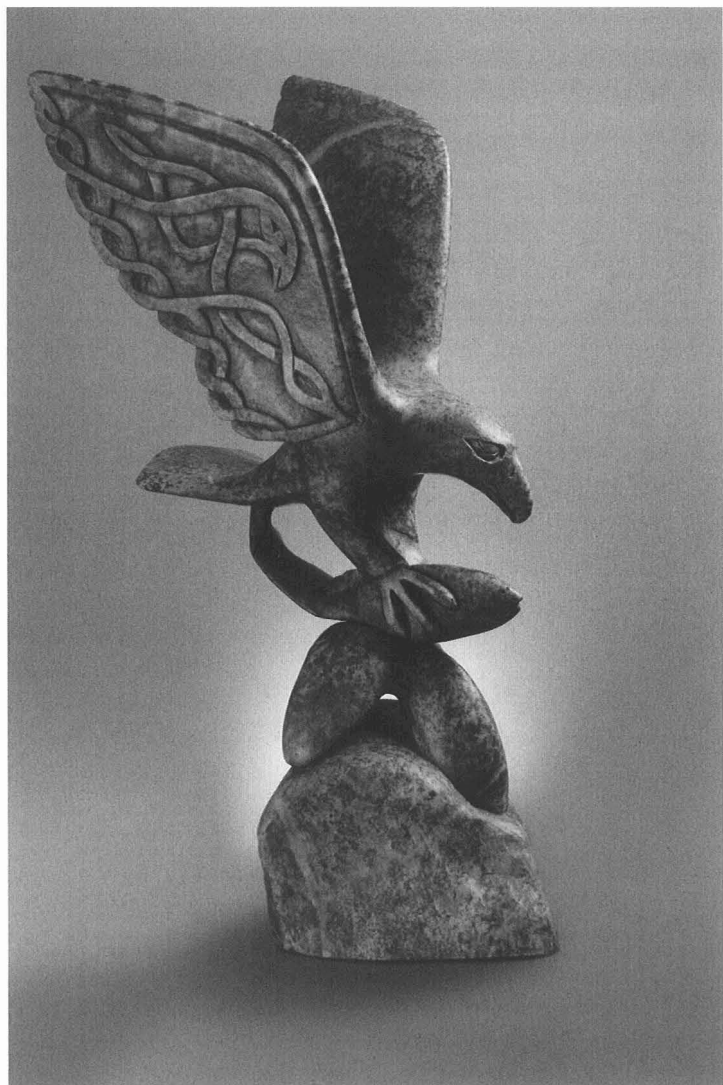
ABRAHAM ANGHIK RUBEN Aigle et saumon (Kipling Gallery))